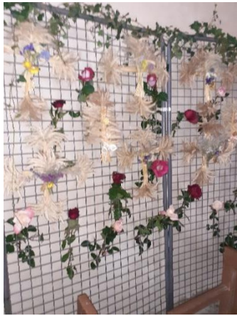
Notre église encore bien décorée